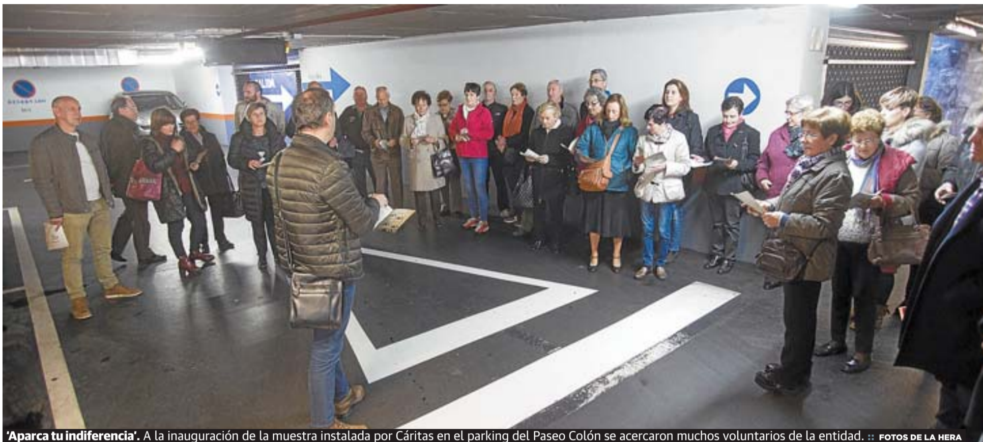
'Aparca tu indiferencia'. A la inauguración de la muestra instalada por Cáritas en el parking del Paseo Colón se acercaron muchos voluntarios de la entidad.