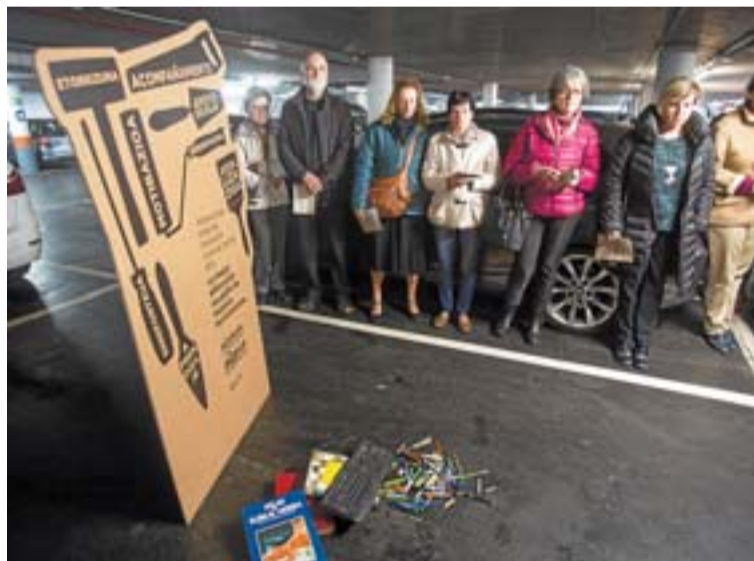
La exposición estará instalada hasta el próximo martes día 28.

las que acompañan diferentes mensajes, como 'STOP a la indiferencia social' o 'Ayuda en todas las direcciones'. En otra de las plazas encontramos un banco de la calle junto a un aviso: 'Mañana podría ser tu casa'.